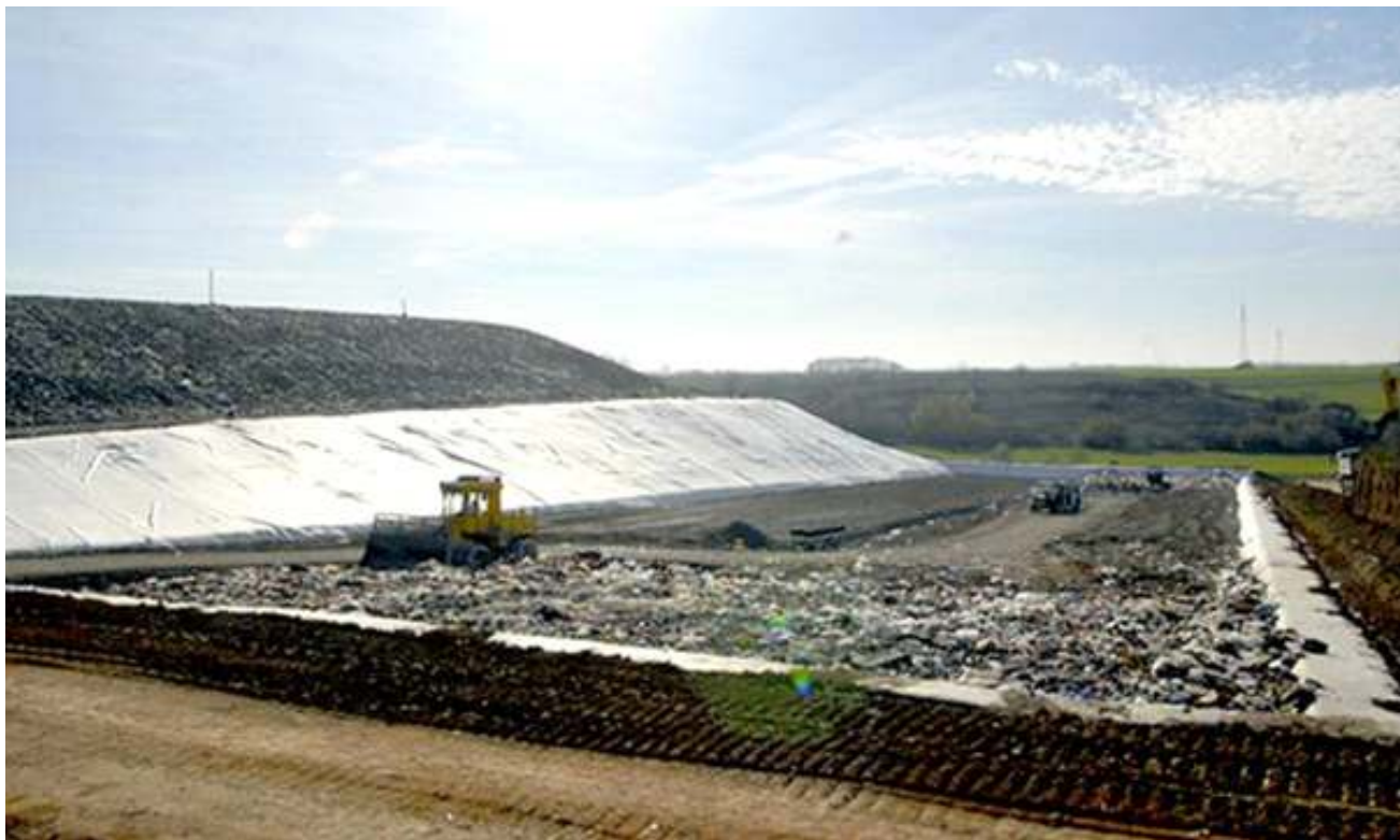
Slika 4.1.1:Odlagalište otpada Vitika Đakovo