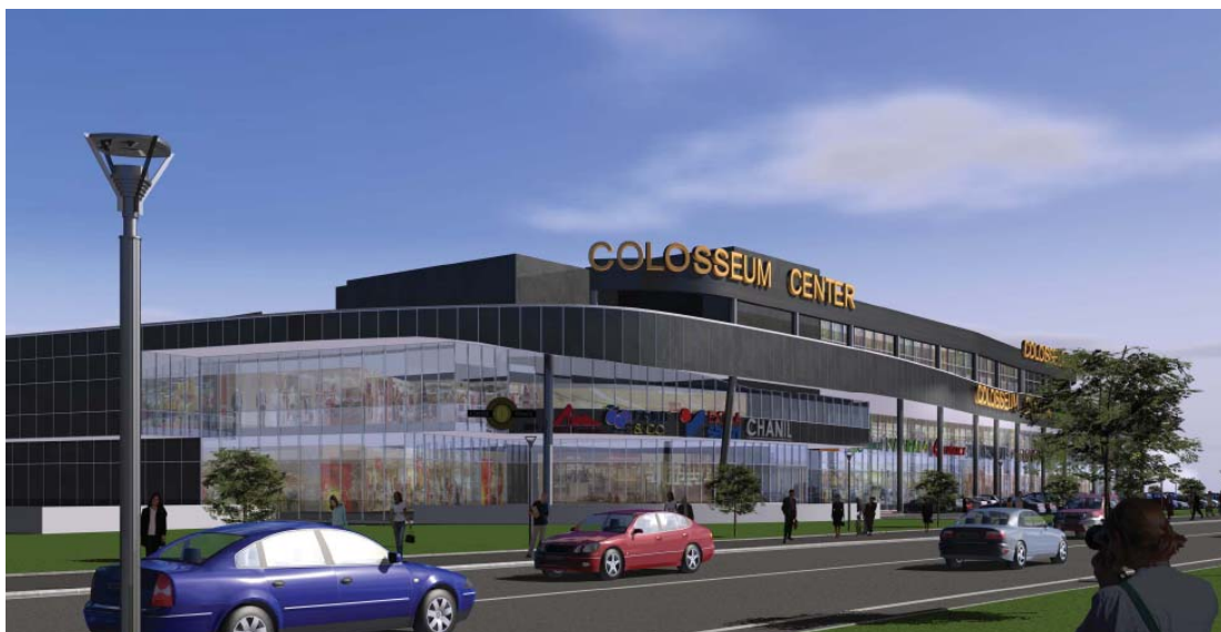
SLIKA 1. Vizualizacija trgovačkog centra

Planirana građevina je trgovačkog karaktera – gradski trgovački centar. U podrumu su smještena parkirališna mjesta, stubišta, šprinkler sobe s bazenom i nekoliko pomoćnih prostora. U podrum se automobilom dolazi sa rampe na južnoj strani. Izlaz je također moguć na toj strani, kao i dodatni na sjevernoj strani građevine. Prizemlje čine poslovni prostori (trgovine, restorani, barovi, kafići,...) s glavnom komunikacijom, te instalacijski prostori, prostor za privremeno skladištenje otpada, te komunikacije. Na prvom katu su također raspoređeni prodajni prostori, a na drugom katu uz prodajne prostore smještene su i četiri dvorane za kino projekcije s popratnim sadržajima. Na 2. katu se nalaze i instalacijski dijelovi građevine tj. kotlovnica i strojarnica.