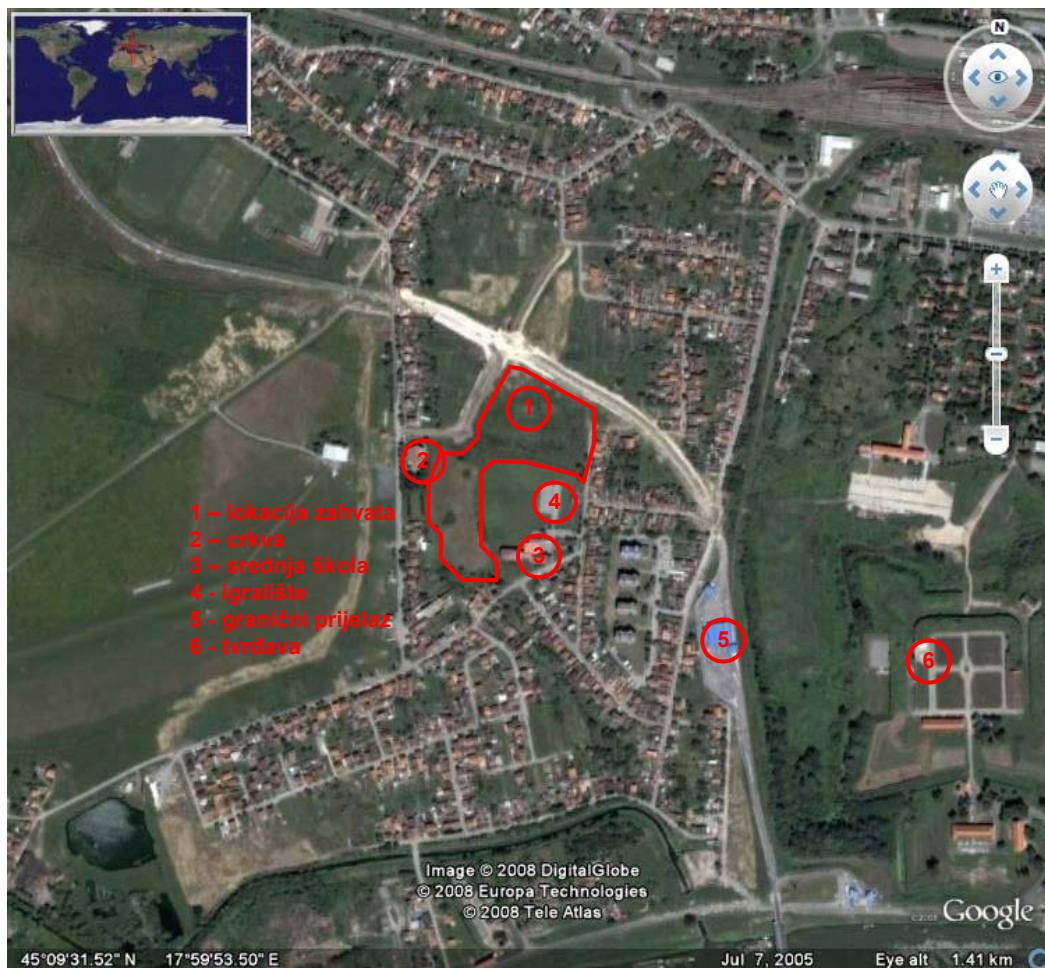
SLIKA 4. Lokacija zahvata na ortofoto snimci