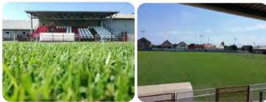
Slika 1. Stadion NK Tomislav Buhač, Donji Andrijevi

Načine postupanja vezane uz prodaju, davanje u zakup ili najam, nabavu roba, radova i usluga i druge oblike upravljanja nogometnim igralištem, od donošenja odluka do evidentiranja u poslovnim knjigama i vrednovanja ostvarenih učinaka, Općina Donji Andrijevi uredila je Odlukom o načinu upravljanja i korištenja sportskih građevina u vlasništvu Općine Donji Andrijevi.