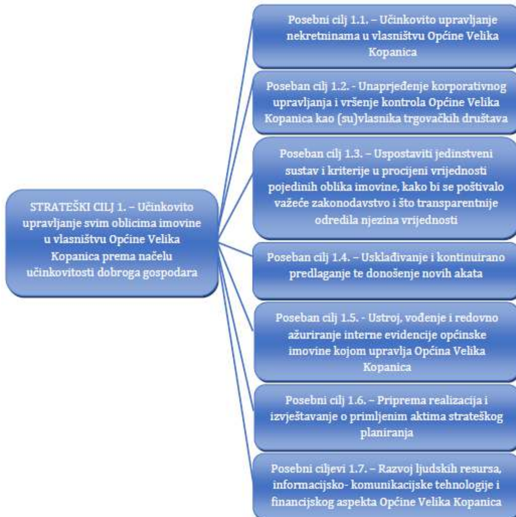
Slika 2. Kaskadiranje strateškog cilja upravljanja općinskom imovinom