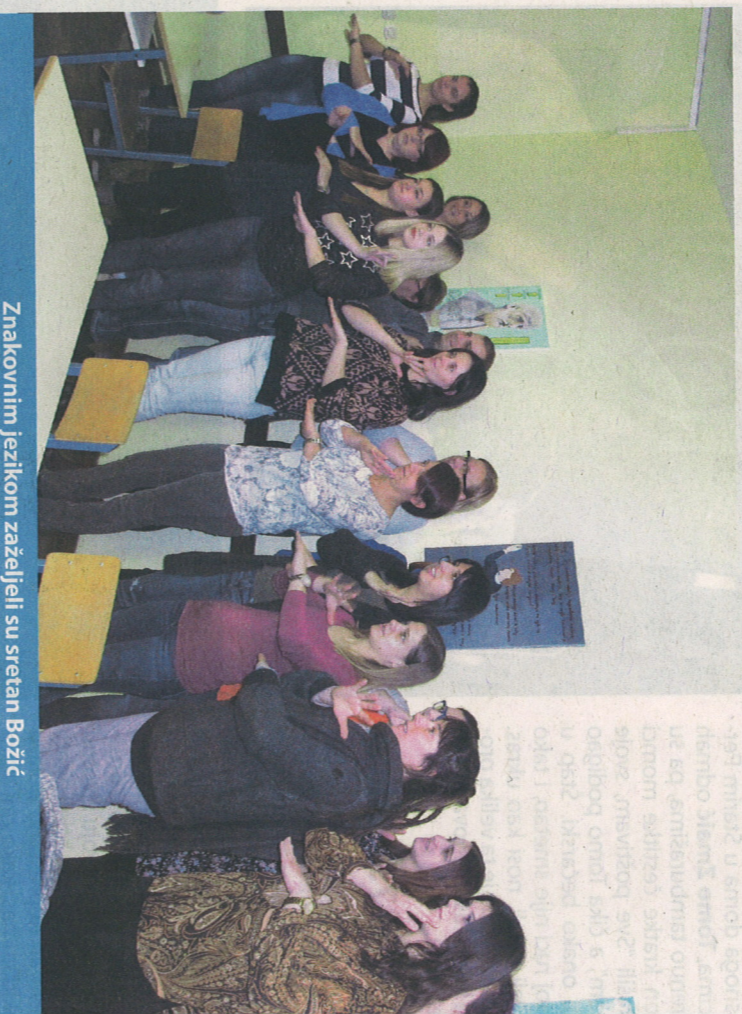
Znakovnim jezikom zaželjeli su sretnan Božić

Svim korisnicima naših usluga, zaposlenicima i njihovim obiteljima te stanovnicima Brodsko-posavske županije