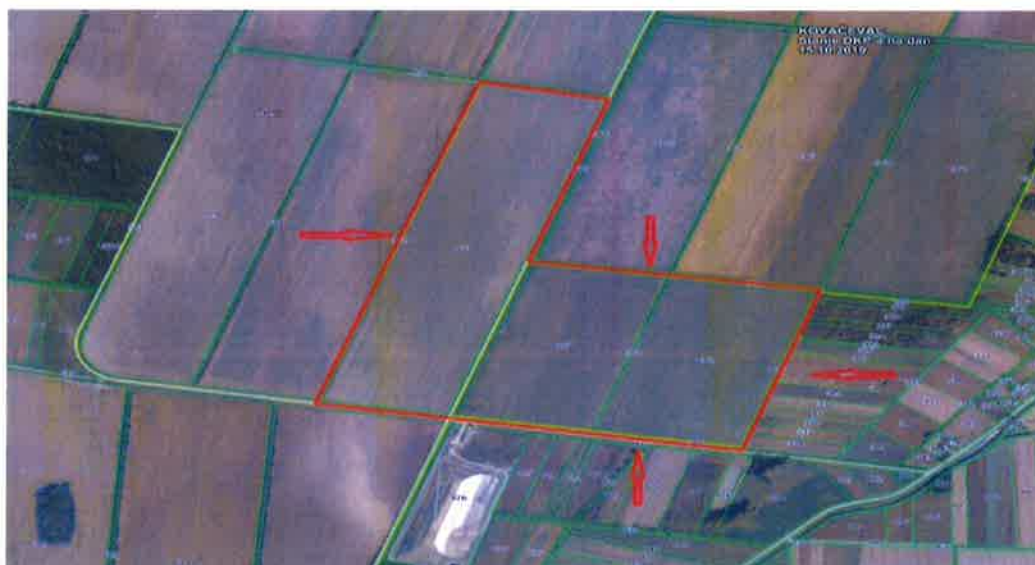
Slika 2.: Lokacija RCGO Šagulje

Ukupna površina planiranog zahvata Regionalnog centra za gospodarenje otpadom Šagulje je oko 52,88 ha.