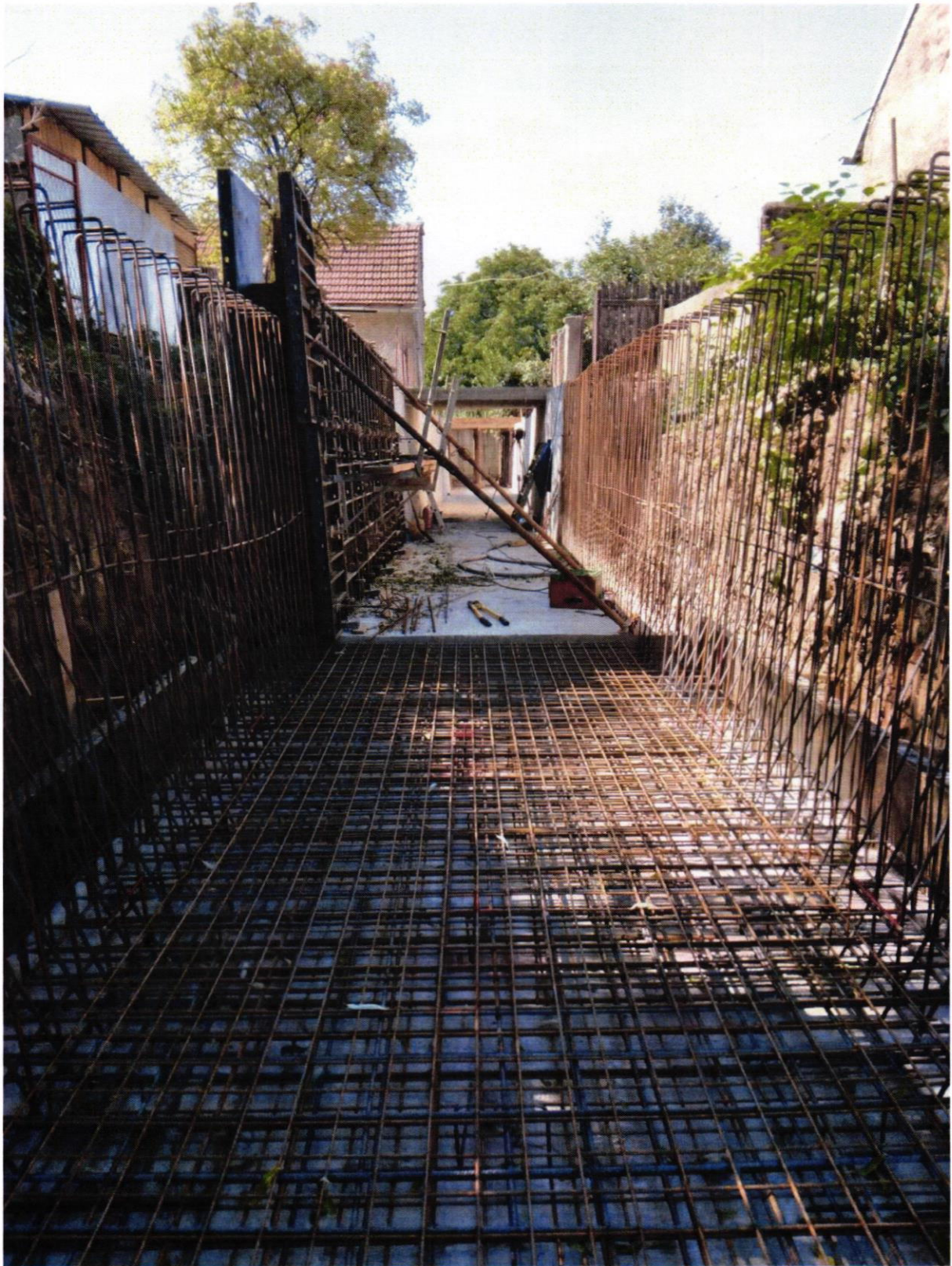
Uređenje kanala Laminac u Novoj Gradiški