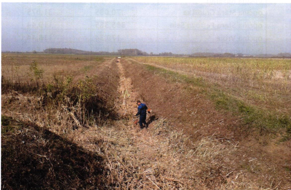
Detaljna kanalska mreža nakon obavljene redovne košnje – općina Nova Kapela