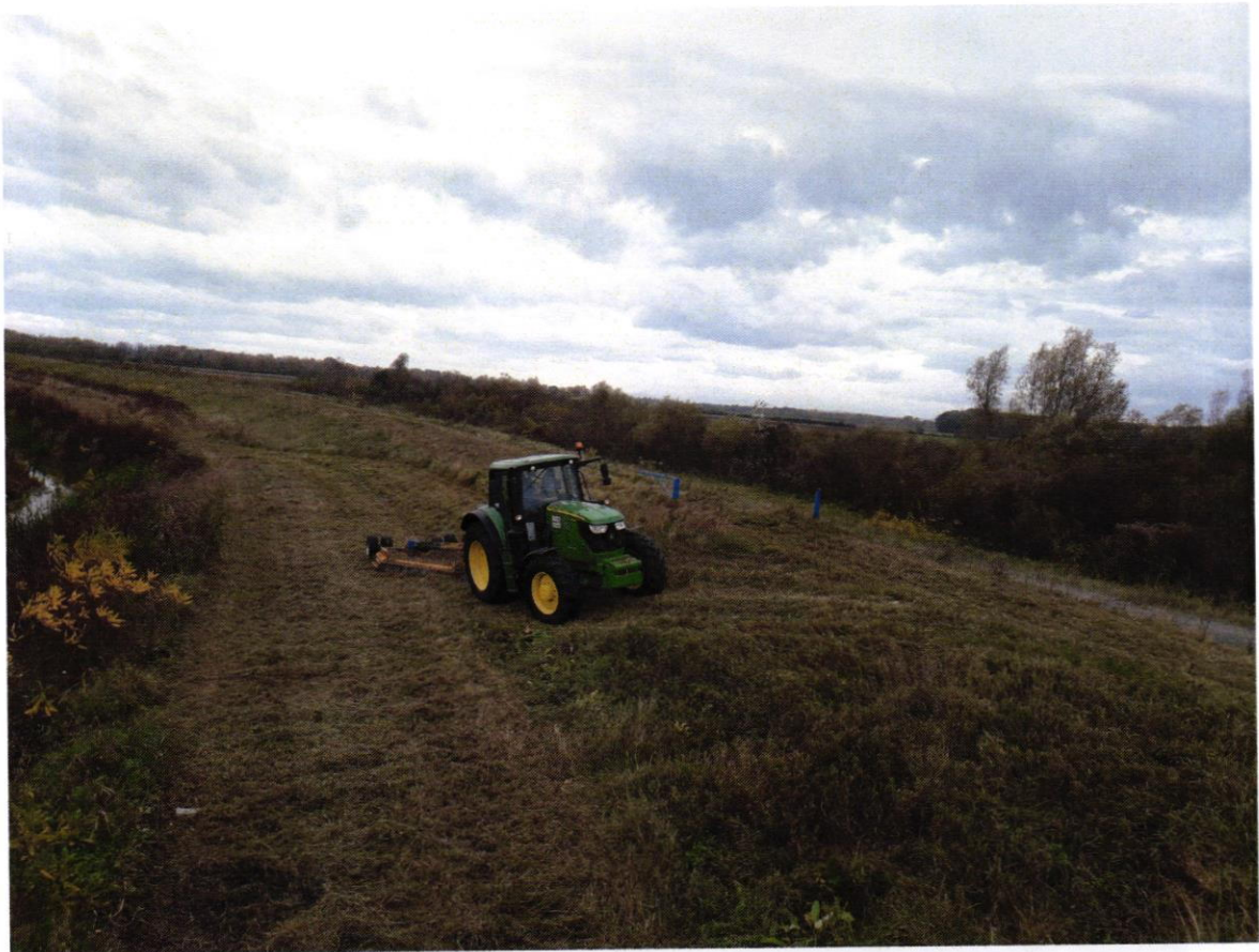
Košnja savskog nasipa