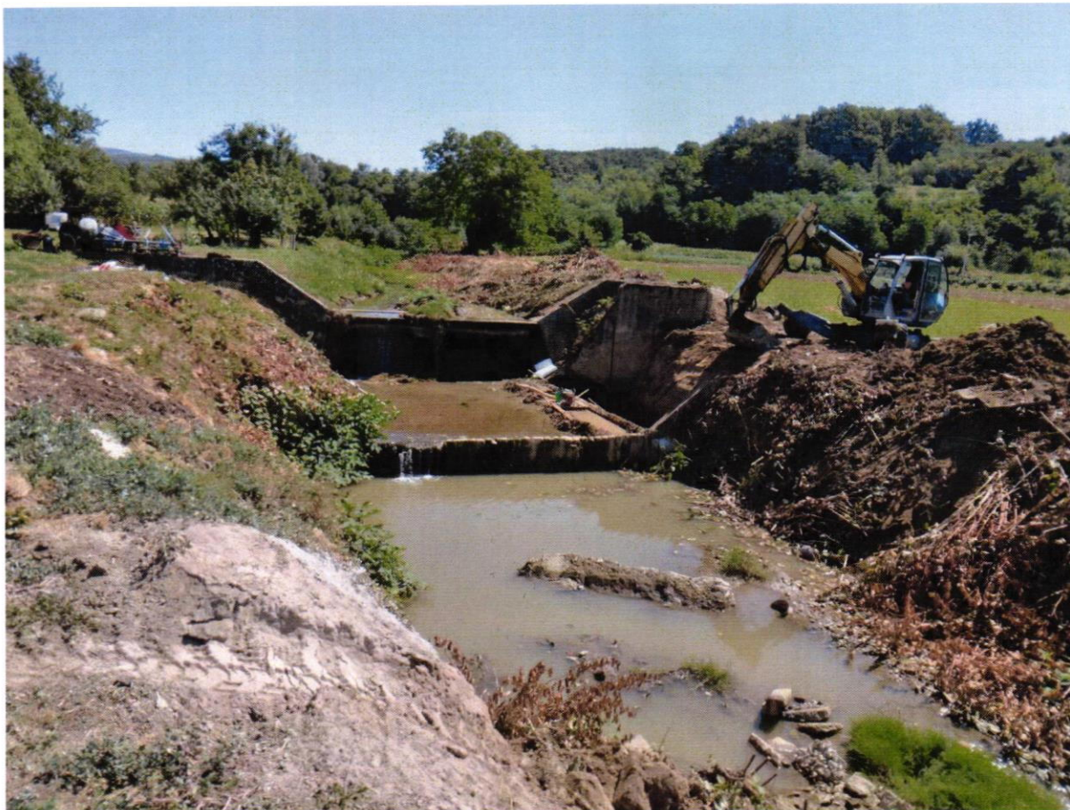
Regulacija potoka Adžamovka u Gunjalcima