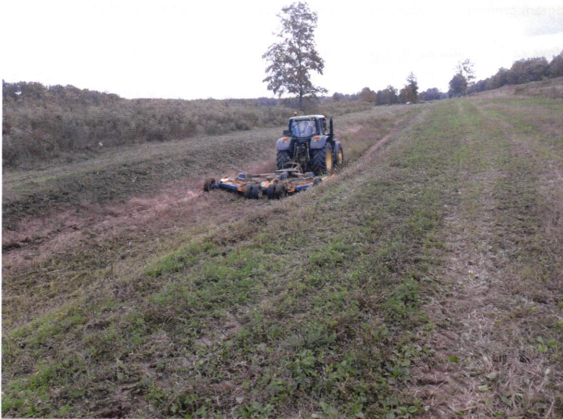
Detaljna kanalska mreža za vrijeme košnje – općina Stara Gradiška