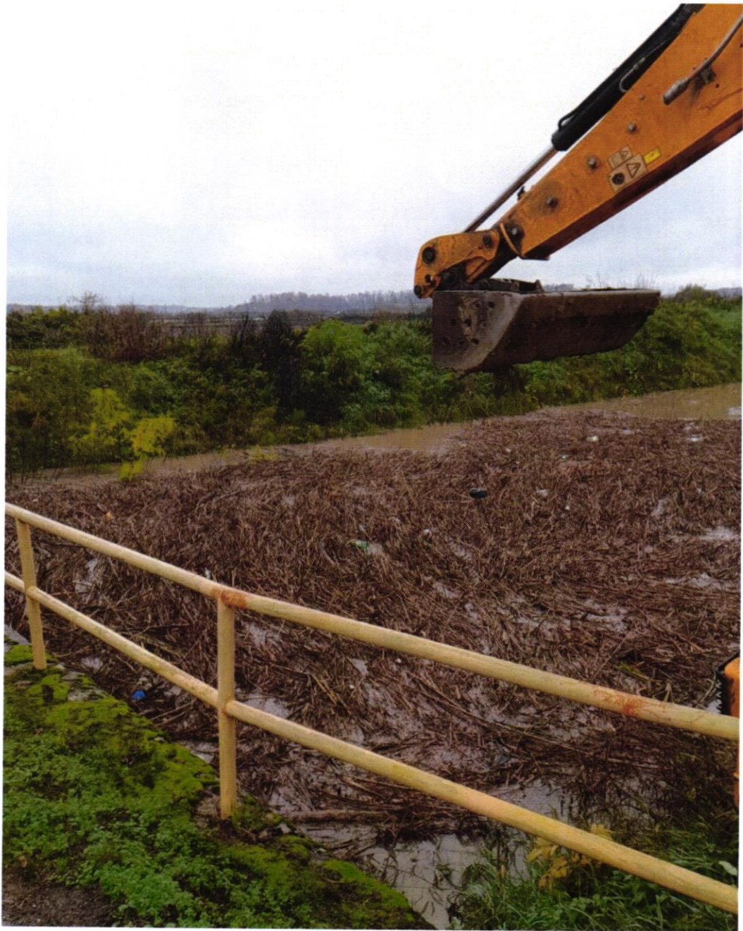
Uklanjanje nanosa iz lateralnog kanala Adžamovka Orjava