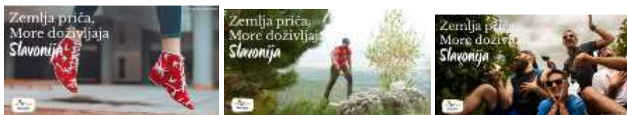
vizuali Zemlja priča. More Doživljaja. Slavonija

Odabrane fotografije za vizuale prikazivale su neočekivane motive svake županije i time dodatno privlačile pažnju.