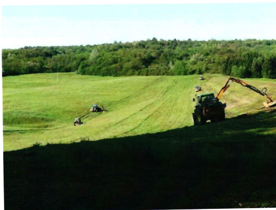
Košnja brane Bačica