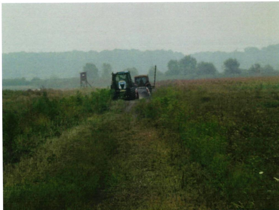
Detaljna kanalska mreža za vrijeme košnje