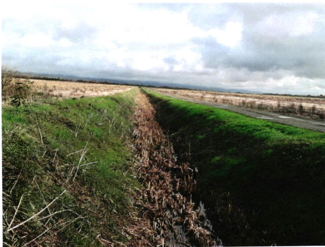
Košnja kanalske mreže u Davoru