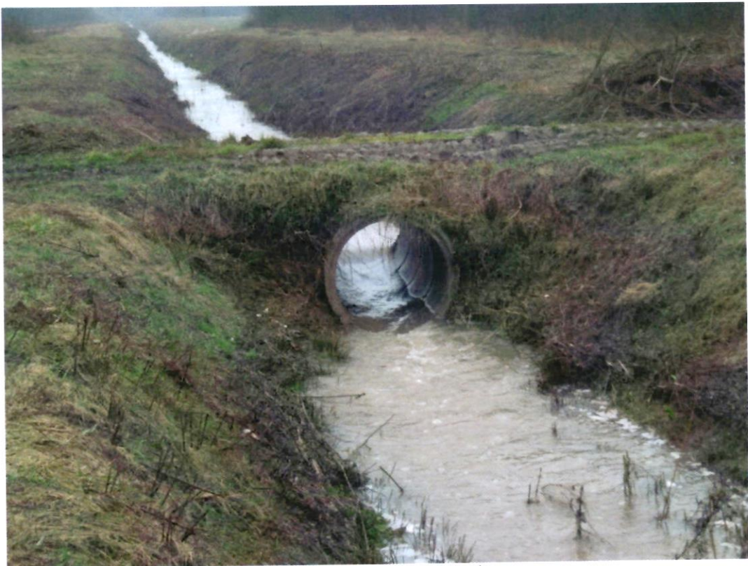
Uklanjanje nanosa iz kanala