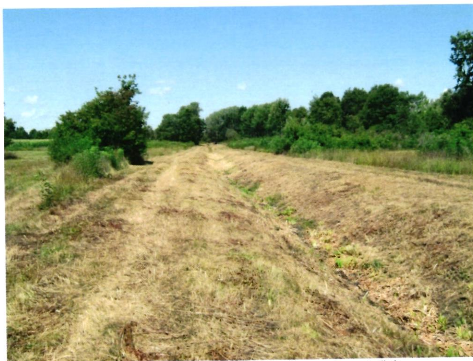
Detaljna kanalska mreža nakon obavljene redovne košnje