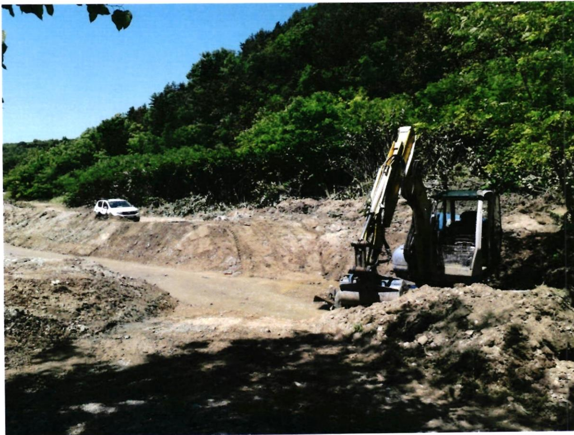
Sanacija potoka Adžamovka u Drežniku